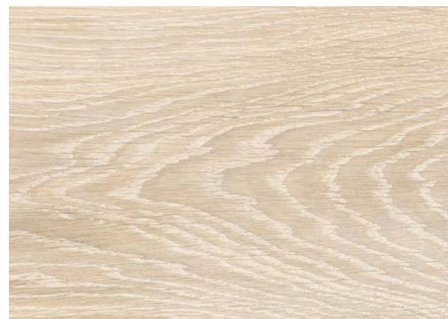
Poncé grain 150 1 × huile Rubio Monocoat Oil, Superwhite