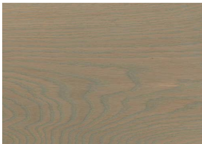
Poncé grain 150 1 × huile Rubio Monocoat Oil, Oyster