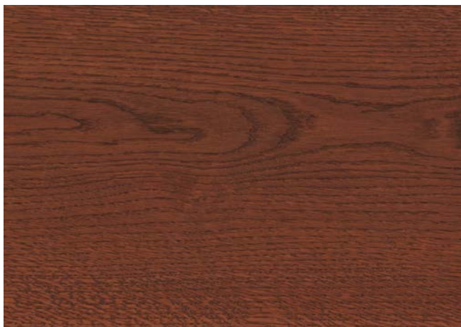
Poncé grain 150g 1 × huile Rubio Monocoat Oil, Mahogany