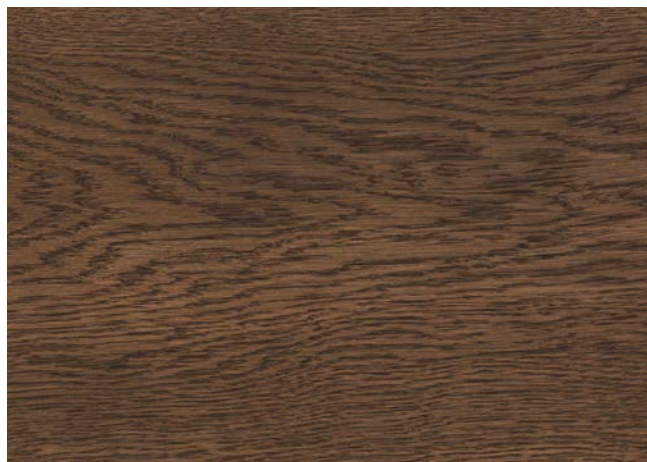
Poncé grain 150 1 × huile Rubio Monocoat Oil, Chocolate