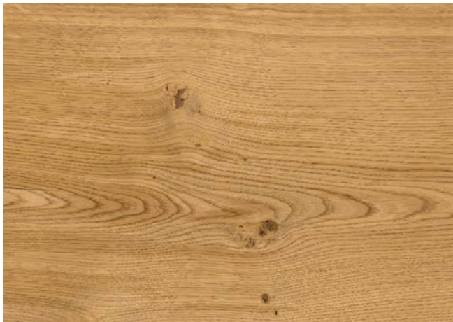
Poncé grain 150 1 × huile 100-0 Natural