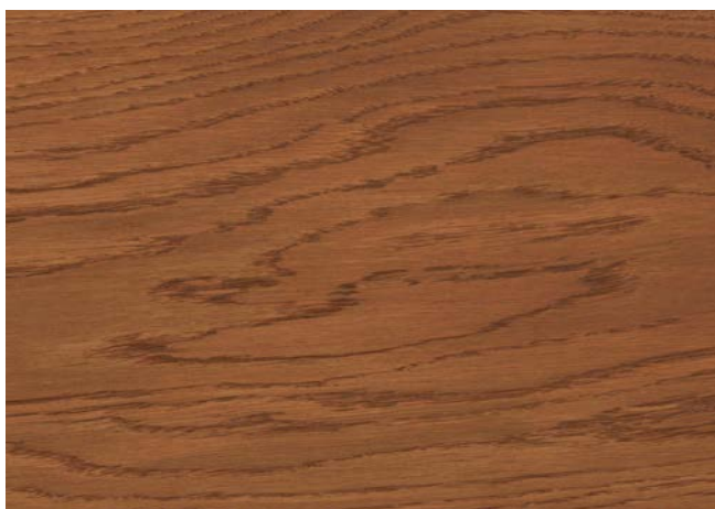
Poncé grain 150 1 × huile Rubio Monocoat Oil, Ice Brown