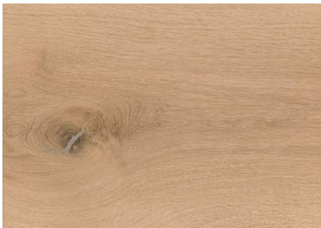
Poncé grain 150 non traité