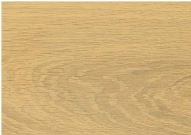
Poncé grain 150 1 × huile Rubio Monocoat Oil, Mist