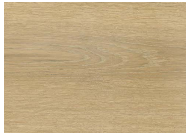
Poncé grain 150 1 × huile Rubio Monocoat Oil, Natural