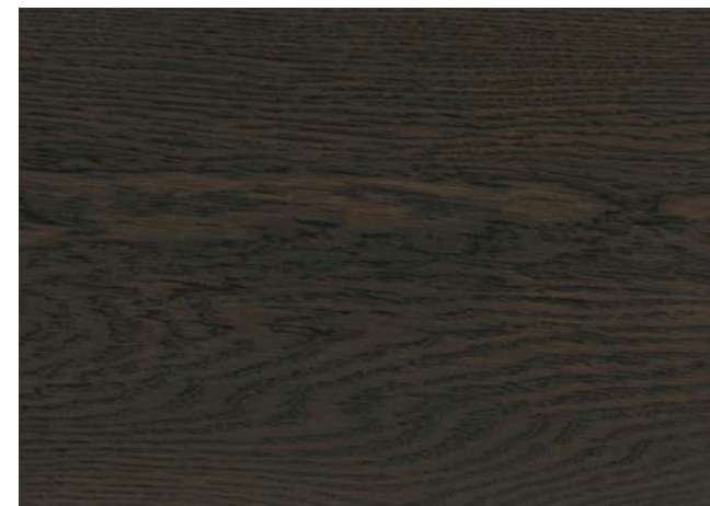
Poncé grain 150 1 × huile Rubio Monocoat Oil, Charcoal