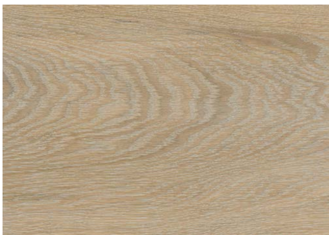
Poncé grain 150 1 × huile Rubio Monocoat Oil, Skygrey