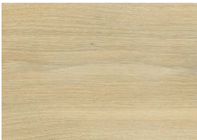
Poncé grain 150g 1 × huile Rubio Monocoat Oil, Smoke