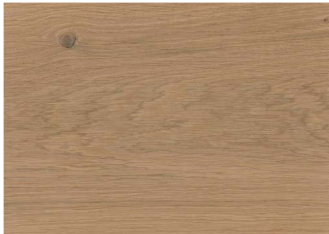
Poncé grain 150 1 × huile nature 90-10 Junckers Oil