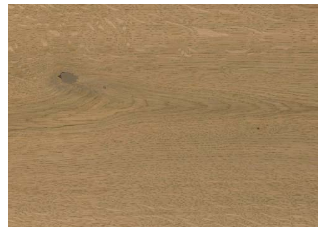
Poncé grain 150 2 × savon nature