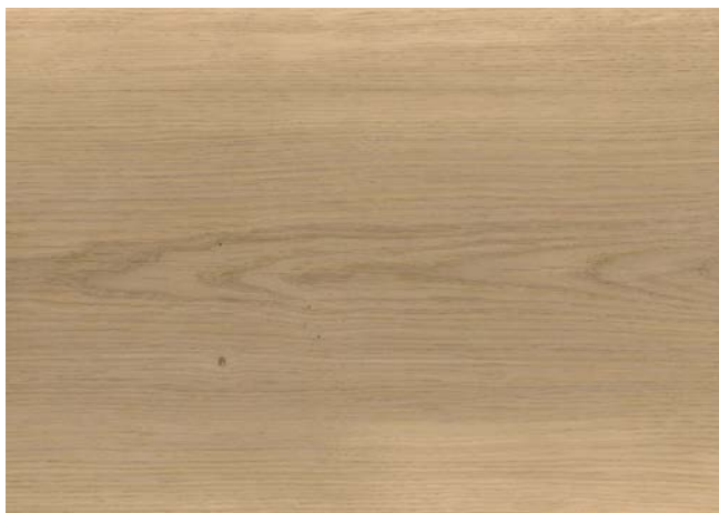
Poncé grain 150 2 × savon blanc