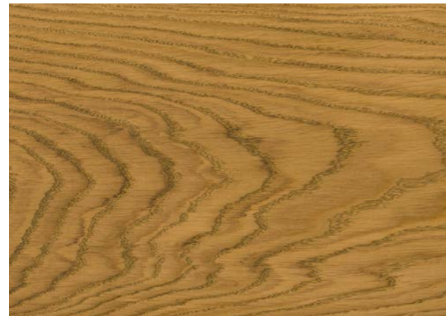
Poncé grain 150 1 × huile Rubio Monocoat Oil, Oak