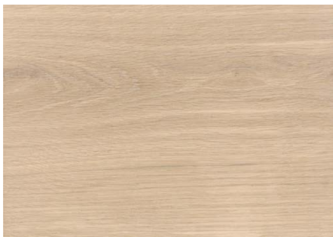
Poncé grain 150 1 × huile Junckers Neutral-Oil