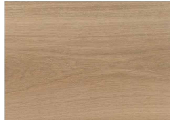
Poncé grain 150 1 × huile nature 50-50 Junckers Oil