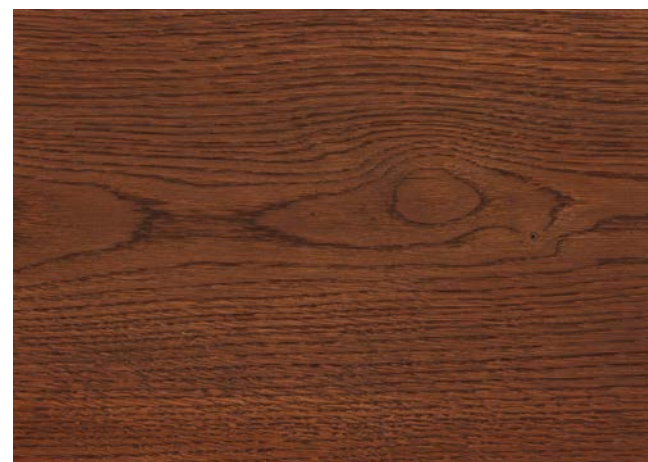
Poncé grain 150 1 × huile Rubio Monocoat Oil, Cherry Coral