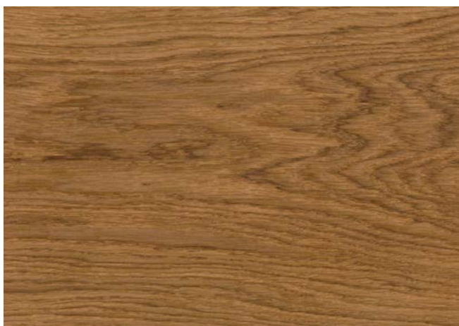
Poncé grain 150 1 × huile nature Woca Diamond Oil