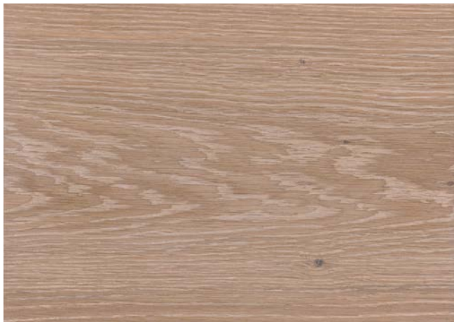
Poncé grain 150 1 × huile blanche Woca No.1